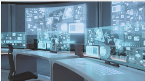
Massive Bio führt branchenweit erstes Kommandozentrum für klinische Onkologie-Studien im NASA-Stil ein

Wir stellen engagiertes Personal ein, um medizinische Aufzeichnungen und Behandlungsgeschichten zu sammeln und Patienten in Frage kommende Studien in der Nähe ihres Wohnortes zuzuordnen. Wir unterstützen Sie während Ihres gesamten Registrierungsprozesses, um sicherzustellen, dass die Logistik abgewickelt wird, damit Sie sich auf Ihre Gesundheit konzentrieren können.